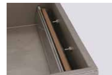
Barre de soudure robuste en acier inoxydable revêtu en téflon