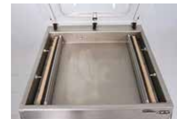
Deux barres de soudure qui permettent de souder plusieurs sacs dans les deux côtés à la fois