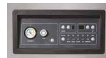
Tableau de fonctionnement digital facile à utiliser avec 10 programmes de travail.