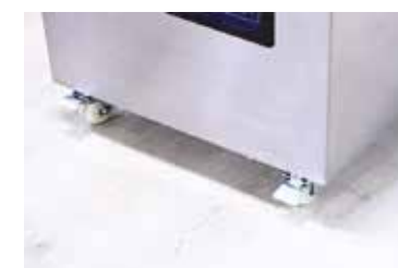
La machine est équipée de roues avec freins pour faciliter le déplacement