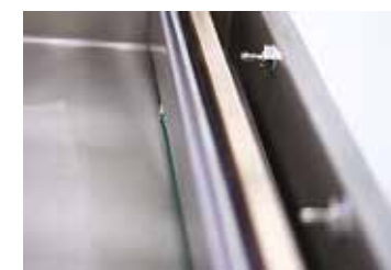
Injection de gaz pour un environnement et un conditionnement optimisé