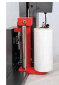
- Tension de film mécanique et réglage de tension par un moteur réducteur.