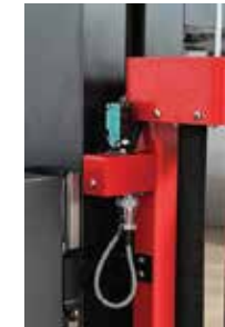
- Photocellule pour la détection de la hauteur de la palette.