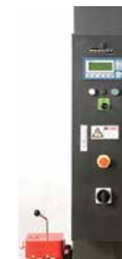
Tableau de fonctionnement avec afficheur Lcd programmable