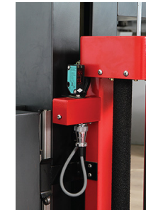
- Photocellule pour la détection de la hauteur de la palette.