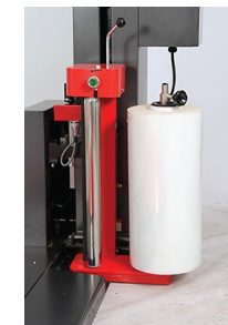
- Tension de film mécanique et réglage de tension par un moteur réducteur.