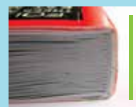
Collage sur le dos

La thermo-relieuse est conçue pour réaliser la reliure thermique des livres en appliquant la colle à dos et latéralement avec deux bacs de colle thermo fusible. La machine dispose d'un afficheur intelligent pour afficher les différents réglages et états de format A4.