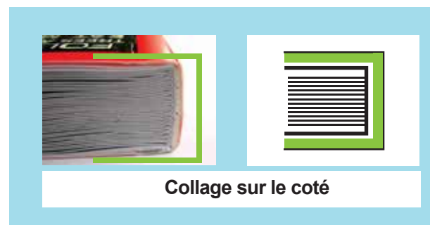
Collage sur le coté