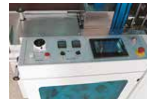
L'interface utilisateur comporte des menus simples pour un fonctionnement facile pour une variété d'applications.