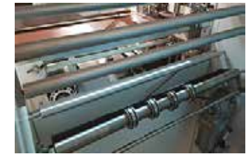
Système de perforation du film pour éviter la formation des bulles d'air