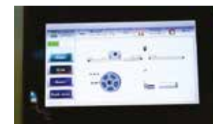
Écran tactile clair, simple et facile à utiliser.