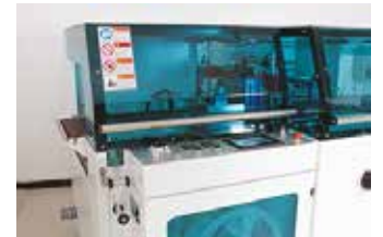
La conception de la machine permet une excellente productivité avec une efficacité dans la soudure et une fonctionnalité absolue.