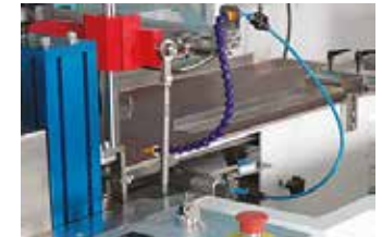
La cellule photoélectrique de sécurité empêche la barre d'étanchéité croisée de contacter l'emballage