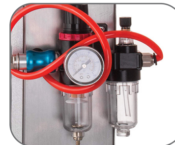
Équipée d'un filtre à air pour assurer une circulation fluide d'air