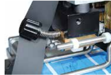
Changement facile des caractères et chiffres du dateur