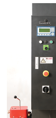
Tableau de fonctionnement avec afficheur Lcd programmable