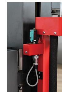
- Photocellule pour la détection de la hauteur de la palette.