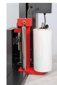
- Tension de film mécanique et réglage de tension par un moteur réducteur.