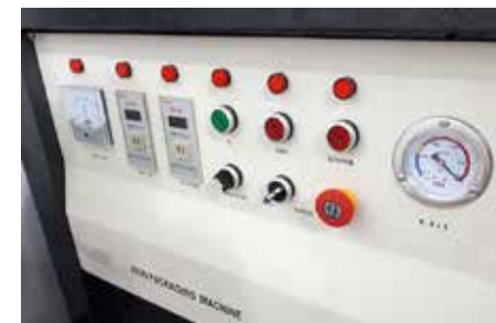
Paneau de fonctionnement simple et facile à utiliser