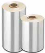
Film rétractable POF, PVC