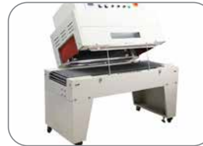
Tunnel ouverant qui permet une maintenece facile