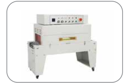
Compact design pour gagner maximum d'espace