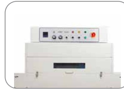
Tableau de fonctionnement facile à utiliser