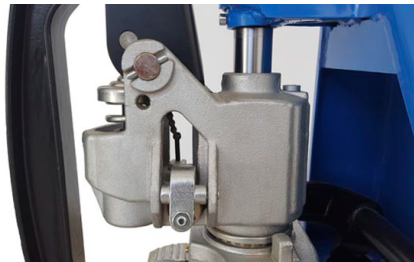
Pompe hydraulique galvanisée, une valve s'ouvre en cas de surcharge pour protéger la pompe.