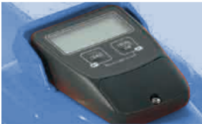
Système de pesage électronique permet.