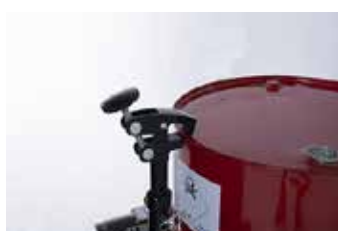
Maintien des objets cylindriques grâce à un bras qui assure la fixation en dessus de l'objet.