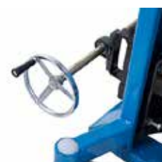
Basculement facile de fût par manivelle