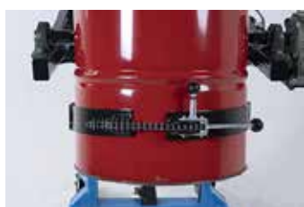
Attachement facile des fûts en métal et en plastique