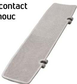
Patins de contact en caoutchouc