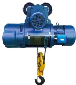
CD1: Palan à câble

Palan à chariot de déplacement latéral électrique