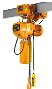
HHBB01E: Palan à chaîne

Palan à chariot de déplacement latéral électrique