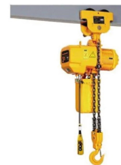
HHBB01M: Palan à chaîne

Palan à chariot de déplacement latéral électrique