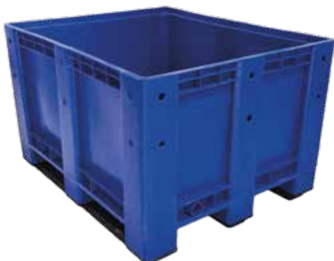
Photo 01 Bac plein