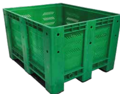
Photo 02 Bac ajouré

Disponible en 04 couleurs avec possibilité d'ajoute des roue pour une meilleur mobilité