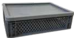
Photo 02 Caisse perforé Grand modèle