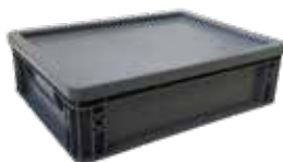
Photo 04 Caisse pleine Grand modèle