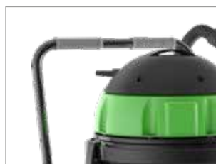
CHARIOT AVEC POIGNÉE